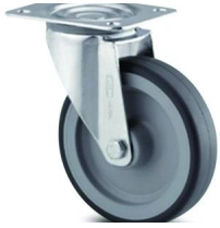
R-E 2 ruedas fijas y 2 giratorias.