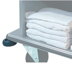
P-C Topes de esquina.