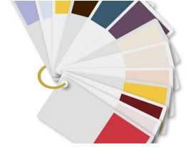
COLLAR Elección de colores. * a partir de 10 piezas o mini carritos de 10