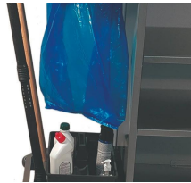
C-B Pinza para escoba.