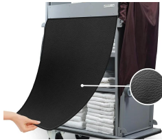
RID Cortina oculta en polipiel negra.