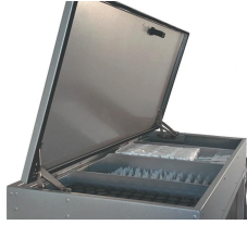
C-125 Couvercle pour b-125.