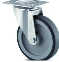
R-E 2 roues fixes et 2 pivotantes.