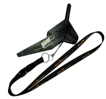
EC-P Ergo-Cale porte.