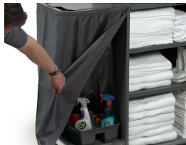
S-C Sac de cache pour le sac à déchets.