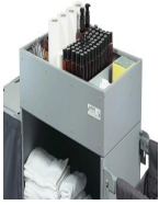
B-125 Bac produits d'accueil 125mm.