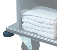
P-C Pare-chocs d'angles.