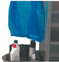
P-E Panier à produits d'entretien.