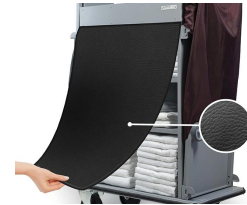
RID Rideau de cache en simili-cuir noir.