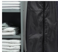
S-130 Sac à linge 130L supplémentaire.