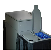
STS 2 sacs poubelles pour séparation des déchets.