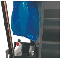
C-B Clip à balai.