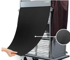
RID Rideau de cache en simili-cuir noir.