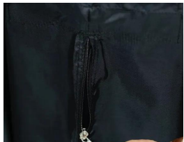
S-130Z Sac à linge 130L avec fermeture éclair.