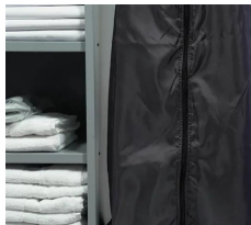
S-130W Sac à linge bleu étanche 130L.