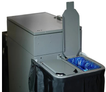
STS 2 sacs poubelles pour séparation des déchets.