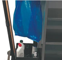
C-B Clip à balai.