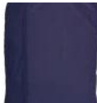
H Housse de protection